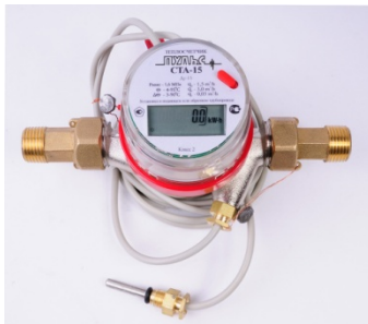
Рисунок 1. Внешний вид теплосчетчика.