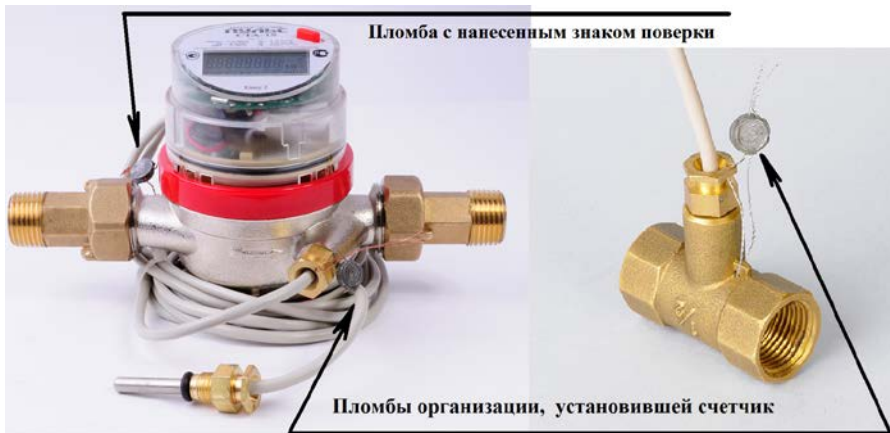
Рисунок 2 – Схема пломбировки теплосчетчика

ВНИМАНИЕ! В случае нарушения или несанкционированного снятия пломб предприятия-изготовителя потребителями, теплосчетчик к эксплуатации не допускается, а предприятие-изготовитель снимает с себя гарантийные обязательства.